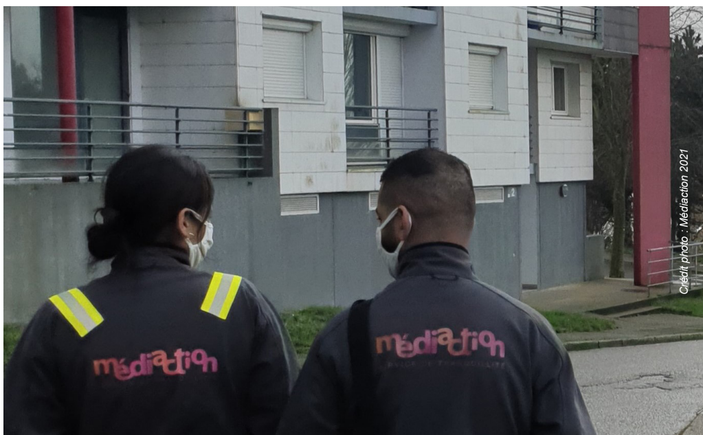
Les agents de tranquillité sont à la disposition des locataires du Quartier des Provinces, 3 jours par semaines, en fin de journée et en soirée.

Sur le même principe, en dehors de leurs jours et horaires de présence, la messagerie est disponible 24h/24 et 7j/7. Laissez votre message en indiquant vos coordonnées, vous serez recontactés dès la reprise de leur service.